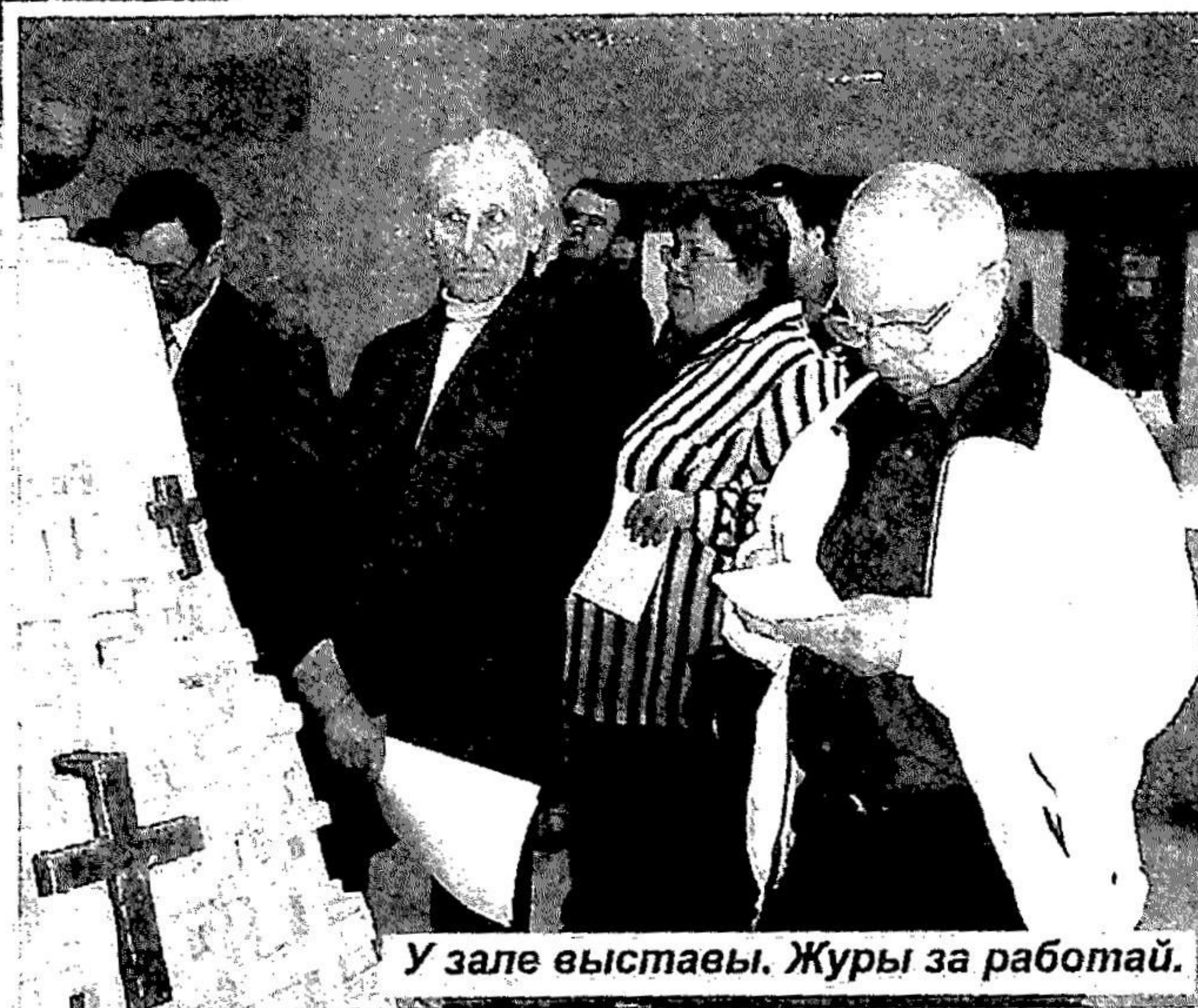
У зале выставы. Журы за работай.