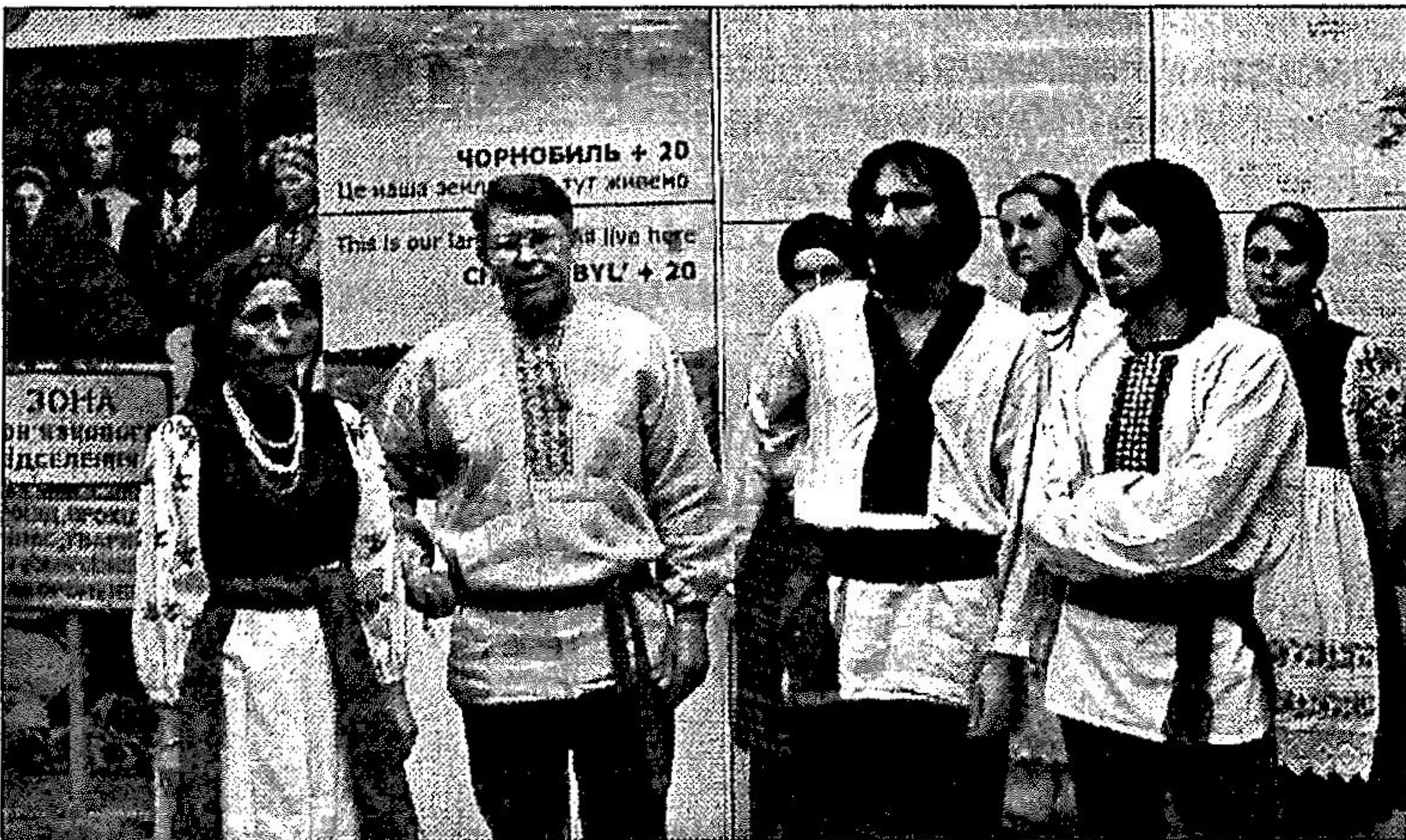
Етнічний гурт "Древо"

На відкритті в музеї Гончара виступали етнічні колективи "Коралі", гурт "Древо", що виконував пісні Полісся. Відомі митці, такі як Михайло Ілленко, висловили свої зауваження з приводу досліджень цього етносу. Була присутня на відкритті і класик української літератури Ліна Костенко, "чорнобильська берегиня", що й сама неодноразово відвідувала Чорнобиль, опікуючись врятуванням поліської культури та долею "самоселів", і