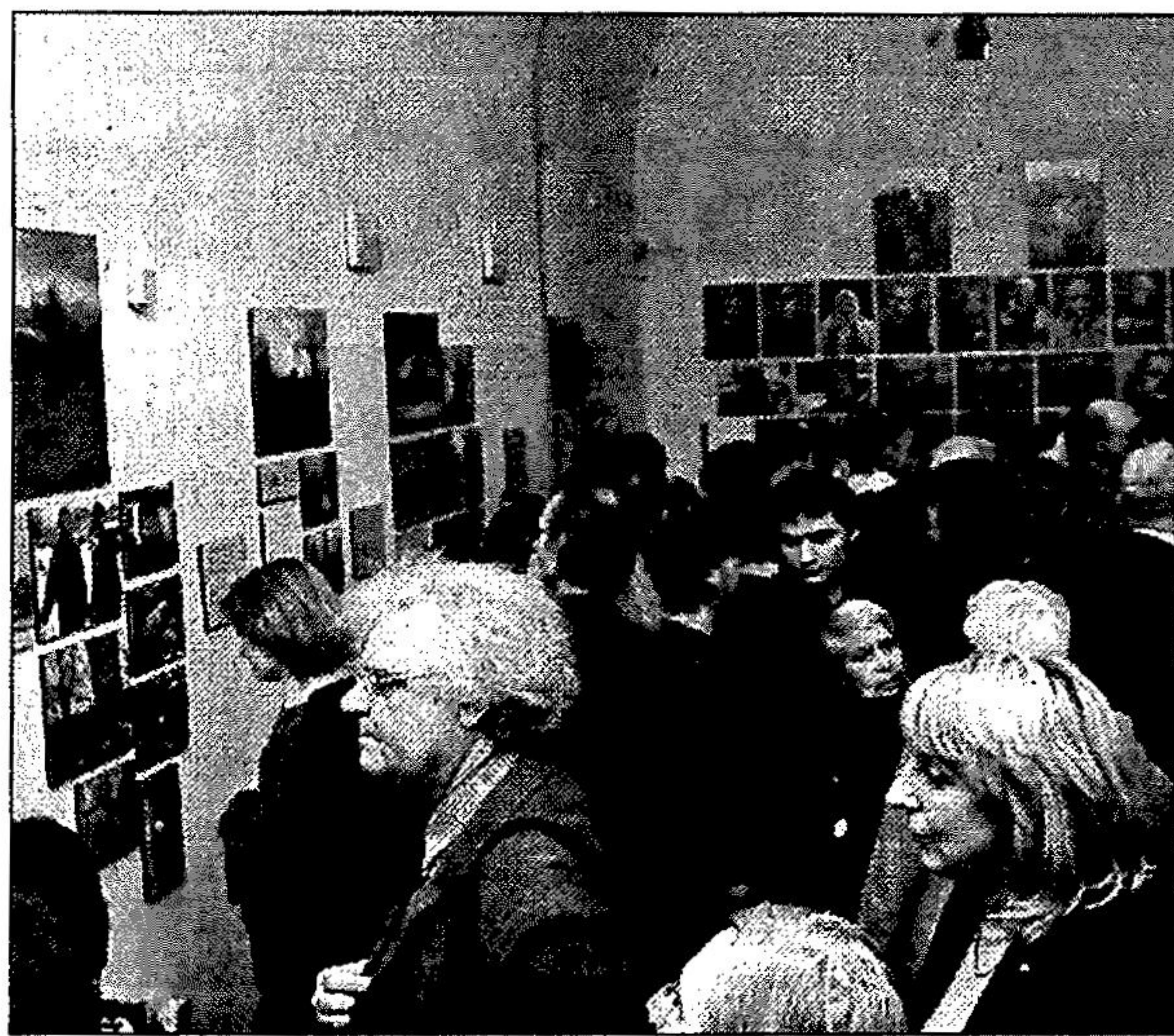
Відвідувачі знайомляться з експозицією

Експозиція представила глядачам такі сповнені життям обличчя, такі мальовничі митця! Та біль від того, що вони тепер усі називаються "зона", не став меншим. Певно, в пам'яті людській є рани, які загоюватися не повинні, бо інакше виникатимуть нові, страшніші, і вже для всього людства смертельні.