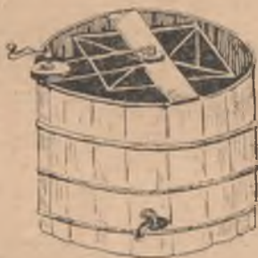
بال چىقاران تىسە نىرۇبەز كا

اوزە كىك يوقارى تارافىنا آغاچ وە يا دەمىردەن بايلىمىش بىر بلانقا كەچىرىلۇپ فوجىنىڭ كەنارلارىنا بە كىتىلەر. بىنە اوزە كىك يوقارى باشىنا تىشلى بىر چارخ قوبۇلۇپ آغاچ بىر ساپ ايله وە ياخود فوجىنىڭ كەنارىنا اىكىنجى بىر چارخ داھا قوبۇلۇپ ال ايله حارە كەتە كەتە بىر بىلەر.