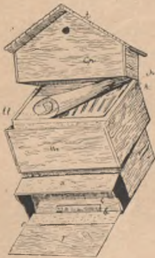
بهارده بالقورتلارك سه به تندن ياشچيكت اوشديريلملارى

سو كرا اوزون بير يىچاقله ياواشجا وه غايهت ساق اولارق يان وه بوقاريسندان سه به تلهرك سولاقلارى كه سيلير. كه سيله سولاق ايجهريسنده كى بال وه بالقورت بسالاجيقلاريله بىرليكده، اوچ يهريندهن تاхта پلانقلار ايله تونديريلماق شارتيله، بوش رامكا- لارك ايجهريسينه قوبولير، پلانقلارك آشغى وه بوقاريدا كى اوجلارى ايب ايله باغلانير. وه ياخود رامكا- لارك بوقارى وه آشغى تاختلارينا اووهلجه ميخ قاقيلير وه بومىخلارا خاج شه كيلنده تهللهر چه كيلير.